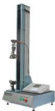
Рис 1. Машина УТС 111.1-1-23

Внешний вид испытательных машин представлен на рисунках 1, 2 и 3.