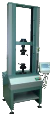
Рис 2. Машина УТС 111.2-50-11