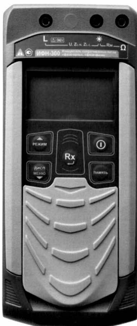
Рисунок 1 – Общий вид измерителей сопротивления петли «фаза-нуль», «фаза-фаза» ИФН-300. Вид спереди