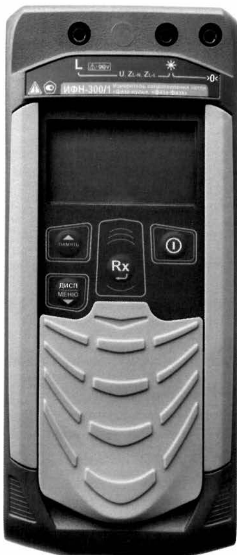
Рисунок 3 – Общий вид измерителей сопротивления петли «фаза-нуль», «фаза-фаза» ИФН-300/1. Вид спереди