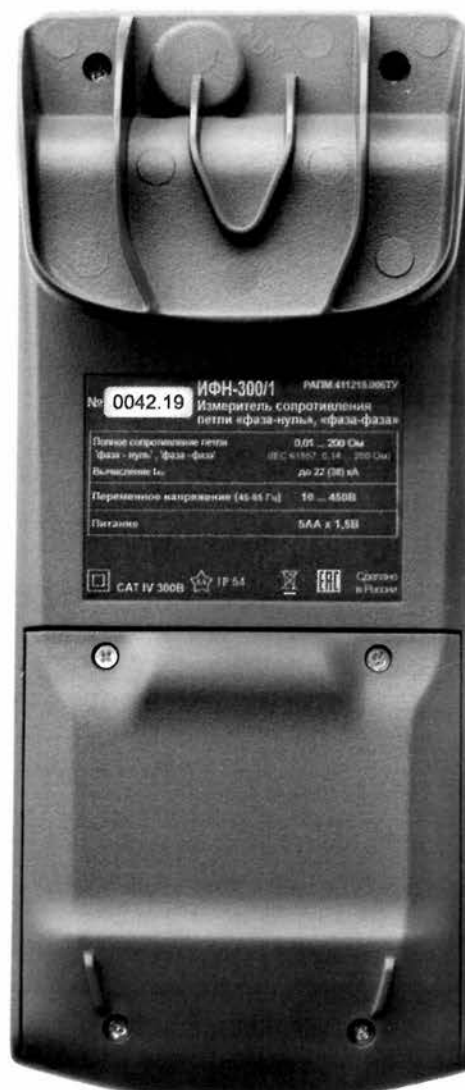
Рисунок 4 – Общий вид измерителей сопротивления петли «фаза-нуль», «фаза-фаза» ИФН-300/1. Вид сзади