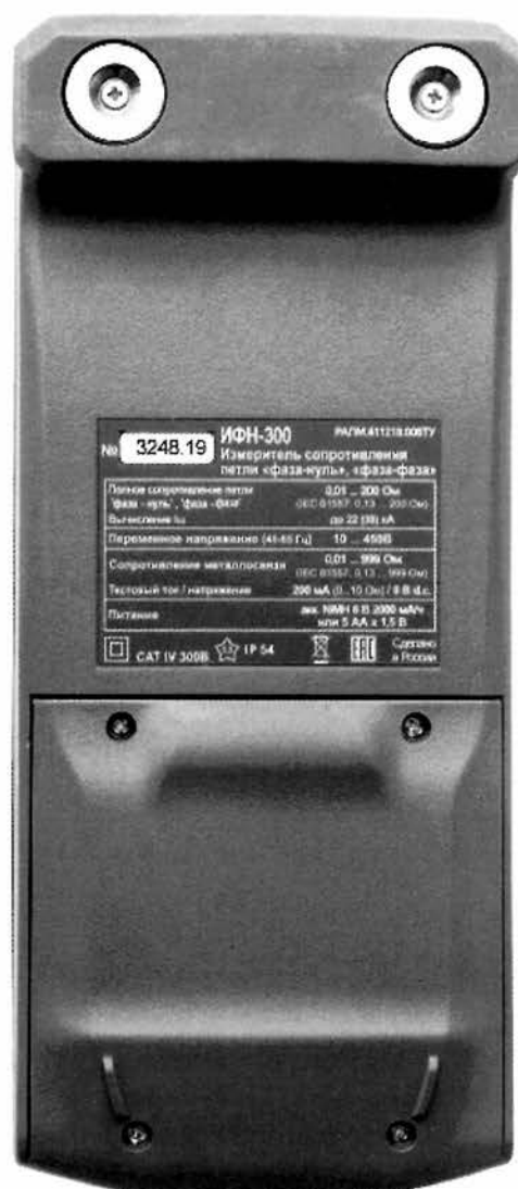
Рисунок 2 – Общий вид измерителей сопротивления петли «фаза-нуль», «фаза-фаза» ИФН-300. Вид сзади