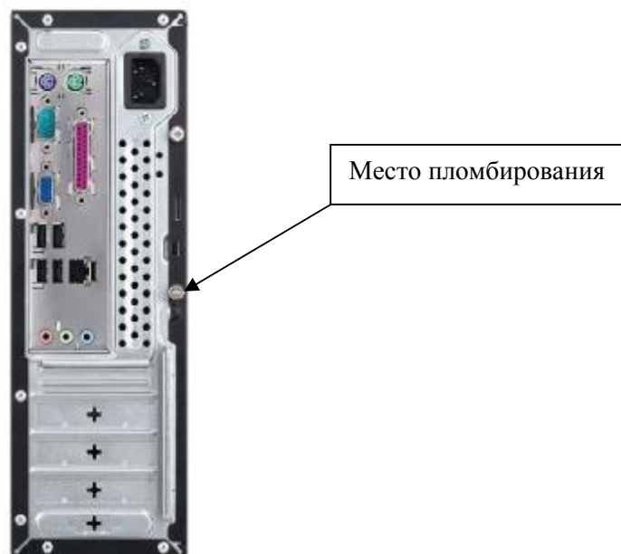
Рисунок 2 - Схема пломбировки электронного блока от несанкционированного доступа