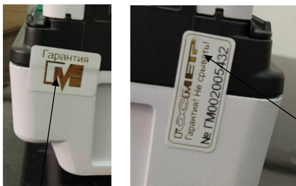
Схема пломбирования контрольными этикетками