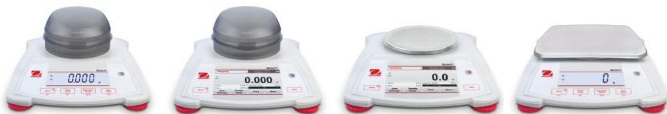
Рис. 1 Общий вид весов Scout

Конструктивно весы состоят из весоизмерительного устройства и электронного блока управления с жидкокристаллическим дисплеем. Весы могут поставляться с дисплеем чёрно-белой подсветки, цветным VGA дисплеем с touch-управлением. Конструкция весов предусматривает возможность взвешивания под весами. Весы с дискретностью 1 мг поставляются с откидывающимся ветрозащитным кожухом, выполненным из прозрачного пластика. Общий вид весов показан на рис. 1.