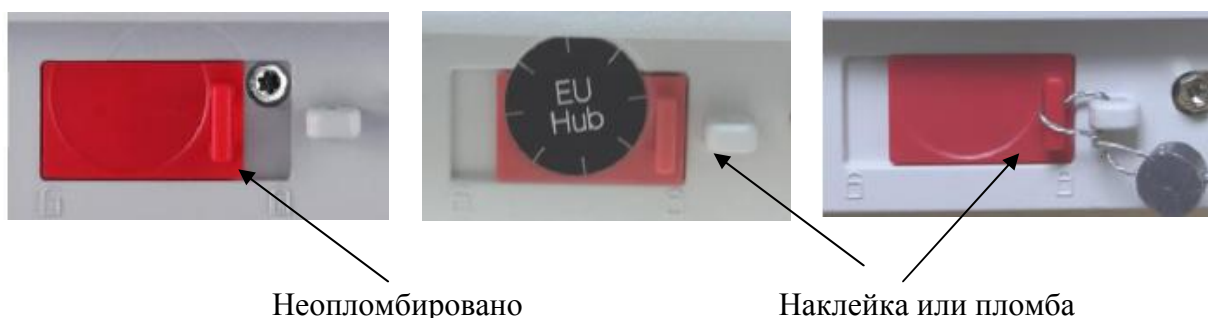
Схема пломбировки весов от несанкционированного доступа приведена на рис. 3.